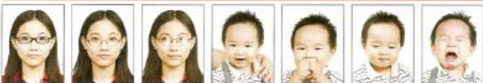
配戴粗框 眼鏡 鏡框遮蓋 到眼睛 鏡片反光 出現其他 人的手 嘴巴被手 遮蔽 閉眼睛 表情不自 然、哭泣