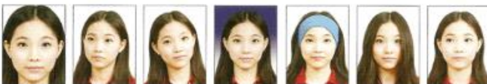
頭髮接觸到 照片邊框 頭部側向 一邊、未 正視鏡頭 頭部傾斜 不正 背景色彩 不一致 臉部及雙 耳被物品 遮蔽 頭髮遮蓋 到眼睛或 耳朵 眼睛未正 視鏡頭