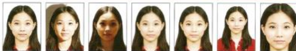
紅眼 背景有 陰影 臉部有 陰影 解析度 過低 模糊、對 焦不正確 頭部比例 過小 頭部比例 過大