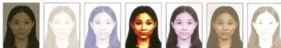
太暗 太亮 對比不足 褪色 對比太強 皮膚色調 不自然 曝光不足 曝光過度